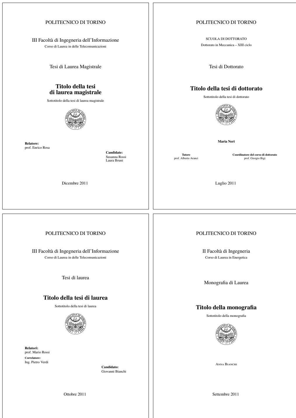
Figura 3.1. I quattro frontespizi fondamentali